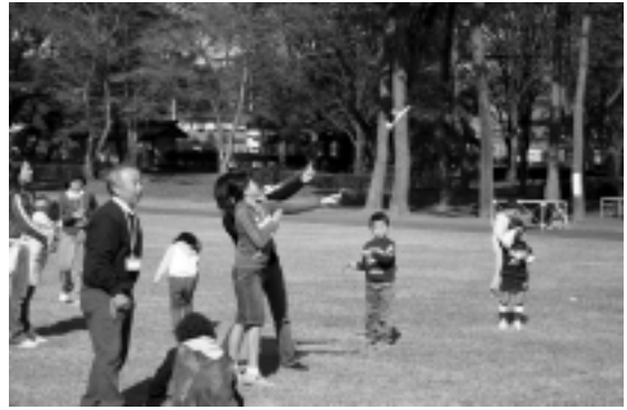
ゴムの力を利用したひこうきが大空にはばたきました

ボランティアグループ『みちくさ』の指導により、一生懸命作った色とりどりの手作りひこうきが空に飛ぶと、参加した子どもたちからは、「わあ、すごいよく飛ぶな。」と驚きの声が上がりました。