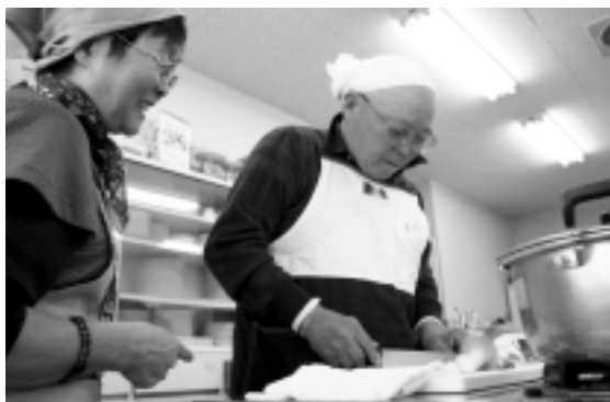
真剣な表情で包丁を入れる参加者