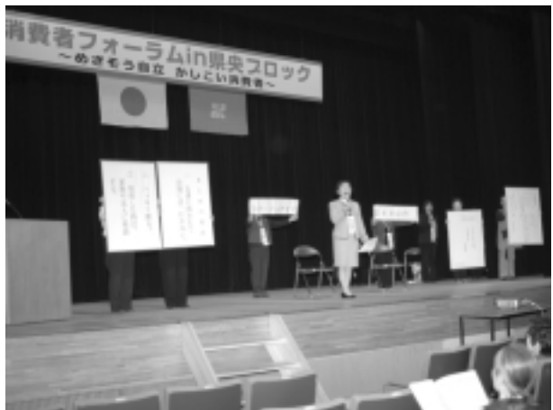
寸劇を披露する上三川町消費者友の会会員