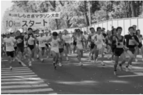
大会の華である10km コースのスタート