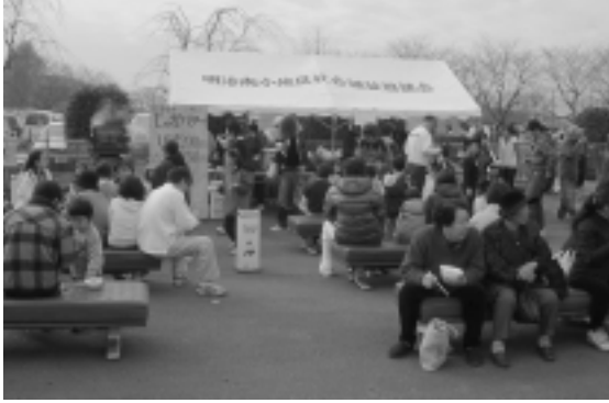
寒空の中でのおでんはとても好評でした