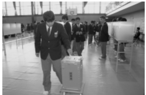
真剣な表情で投票用紙を入れる生徒

生徒たちは、真剣な表情で投票用紙に候補者の氏名を書き込み、投票箱に入れていました。