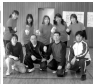
ソフトバレーで優勝した並木新生ビーンズ(左側)と中年の星ゆうきが丘(右側)