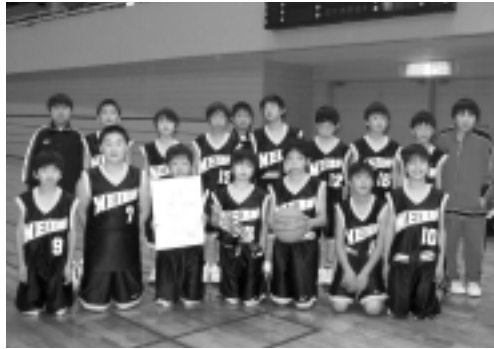
準優勝の明治南ミニバス男子