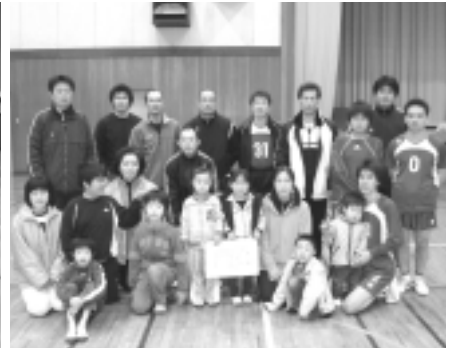
一般バレーで優勝したフライヤーズ(左側)とゆうきが丘(右側)