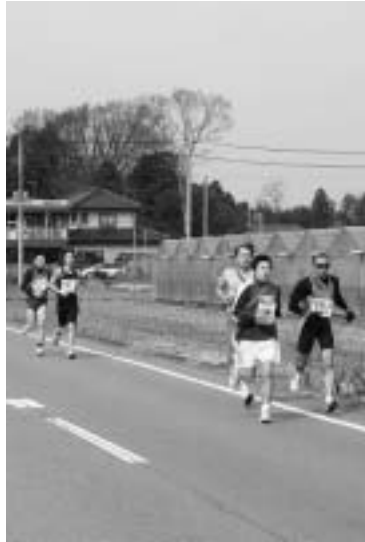
混戦を抜け出すのは…