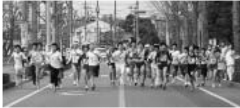
第1区間のスタート