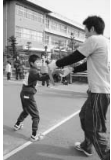
親子でタスキをつなげます