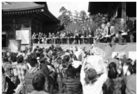
縁起物を拾う人たち