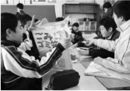
自作の看板を製作する小学生たち