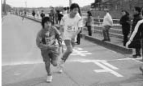
タスキをつないで追いつけろ