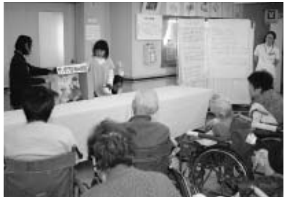
拍手喝采を受けた小学生による人形劇