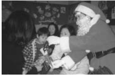
すすくサロンクリスマス会(大山児童館)