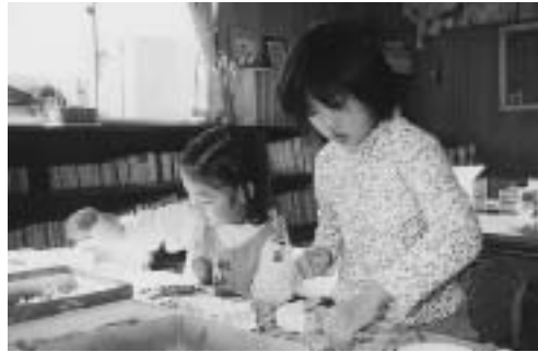
クリスマスリース作り(願成寺児童館)