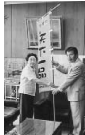
この旗が目印です