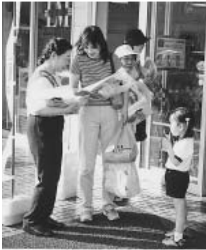
街頭啓発をする実施委員会委員