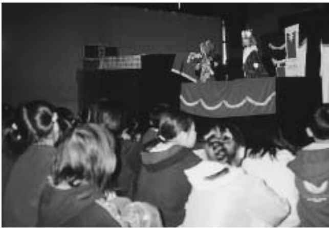
4館合同児童館フェア（12月4日）