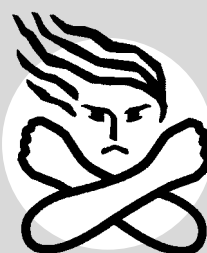
(女性に対する暴力根絶のためのシンボルマーク)