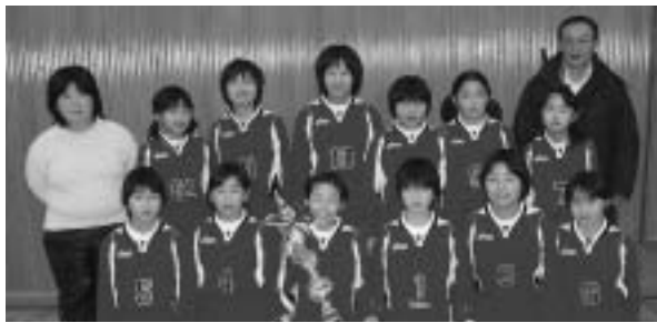
本郷バレーボールクラブ