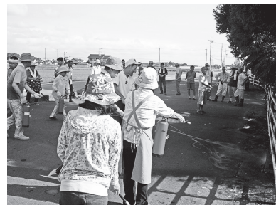
自主防災組織による勉強会の様子