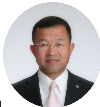
上三川町長 星野 光 利

今後は、「上三川町教育大綱」を基に、社会環境の変化や町民の皆様のニーズに適切に対応しながら、生きる力を備えた心豊かで逞しい人間が育まれるよう、町長部局と教育委員会が一体となり、本町のさらなる教育の充実に向け全力で取組むとともに、家庭や学校、地域コミュニティ、行政が一体となった社会総ぐるみの人づくりを推進し、次代に輝く安心・活力のまち上三川を目指してまいります。